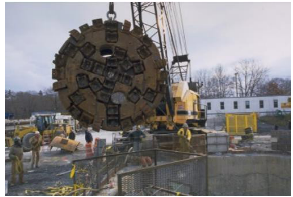
egzanp tèt foraj machin nan tinèl

Pou Pwogram nan, objektif la se vibrasyon sòl la transmèt ki ka asosye avèk konsekans yo nan peryòd konstwiksyon an. Kapab gen vibrasyon avèk aktivite konstwiksyon yo, aktivite tankou bataj poto, foraj TBM, epi fouy nan foraj ak fouy nan eksplozyon dinamit. Anjeneral, nivo vibrasyon yo nan operasyon TBM anba tè se nivo ki ba parapò avèk aktivite konstwiksyon nòmal nan kamyon, pèl mekanik, ak lòt ekipman yo itilize nòmalman nan anplasman pui yo. Fouy avèk foraj ak fouy nan eksplozyon dinamit ki nesèsè pou konstwiksyon pui a ta kreye pifò vibrasyon an, men sa ta diminye. MWRA pral fè yon Analiz Eksplozyon epi n ap prepare yon Plan Konsepsyon Eksplozyon anvan gen nenpòt aktivite eksplozyon. Dokiman sa yo ap detèmine prekosyon nou ta dwe pran pou evite domaj posib akòz vibrasyon yo. Eitou pa pral gen eksplozyon nan tout chantye yo.